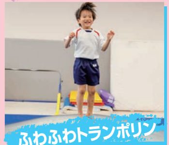
ふわふわトランポリン