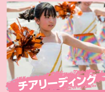
チアリーディング